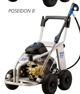
POSEIDON 8 ST